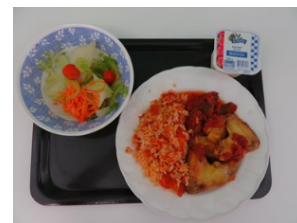
ある日の 給食 (パンが 付きます)

4月から給食が再開しました。全職員の協力のもと、感染症対策を十分に行い、実施しています。水曜日の朝、「今日の給食が楽しみ」と登校してくる子や、「美味しい」と言って給食を食べている子供たちの笑顔を見ると、給食が実施できて本当に良かったと感じています。